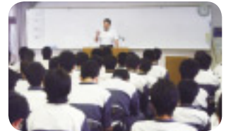
大学生を対象としたセミナーの様子

多重債務相談の専任者を県下各地に配置し、実際に悩まれている方への生活再生に向けた相談活動を展開しています。2010年度は539件の相談に対応しました。また、各種融資制度を取り扱うとともに、多重債務問題等に関する法的対応を必要とした場合の弁護士や司法書士とのネットワークも築いています。