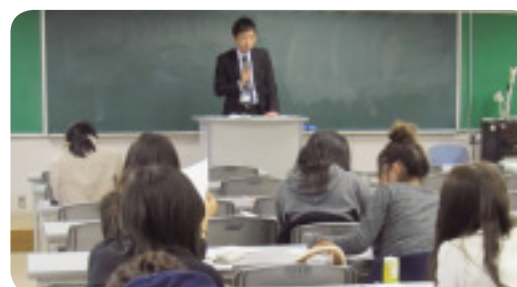
大学生を対象としたセミナーの様子

〈ろうきん〉の職員と専門家のネットワークで構成するロッキースタッフにより、多重債務問題・悪質商法などに関するセミナー等を開催しています。また、多重債務問題・悪質商法などの消費者トラブルを未然に防止するために、大学生や高校生、中学生等、これから社会人となる方々を対象とするセミナーも開催し、金融に関する学習・啓蒙活動を実施しています。2011年度は合計で120回開催しました。