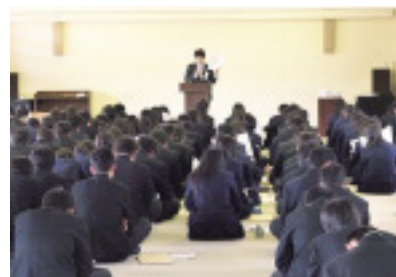
高校生を対象としたセミナーの様子

引き続き、消費者教育の推進に関する法律「消費者教育推進法」を踏まえ、多重債務問題の予防（消費者教育・啓発活動）と救済の両面から活動をすすめ、消費生活相談を積極的に展開します。