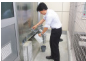
リザーバタンク機能付の受水槽